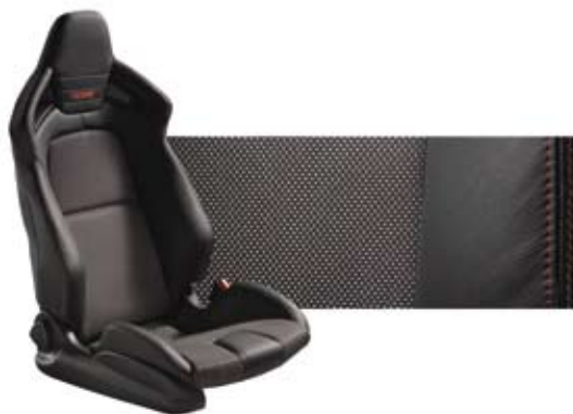
RECARO-Sitze, Innenfarbe schwarz, rote Ziernähte, Farbcode FG7

Bei einigen unserer modernen Metallic-Lackierung werden bewusst unterschiedliche Farb-Pigmente verwendet. Dadurch werden unter bestimmten Lichtverhältnissen, z.B. direktem Sonnenlicht, attraktive Farbeffekte erzielt. Zum Teil kann die Farbe changieren, z.B. von schwarz zu dunkelblau. Die hier abgebildeten Farbmuster geben aus drucktechnischen Gründen Farben ohne Farbeffekte wieder.