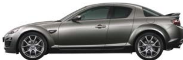
Plutossilber Metallic (38P)