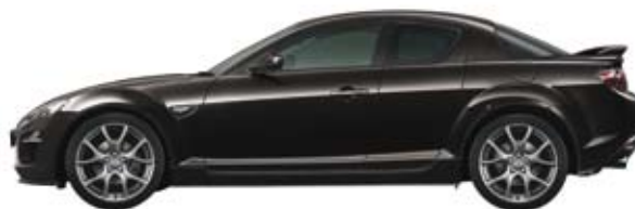
Anubisschwarz Metallic (35N)