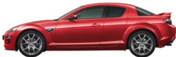
Tornadorot Metallic (27A)