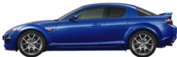
Nereusblau Metallic (34J)