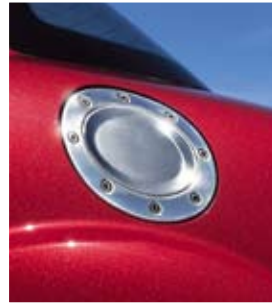
Tankdeckel aus poliertem Aluminium