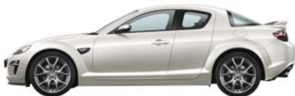
Arachneweiß Metallic (34K)